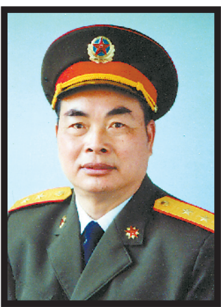
黄玉章同志遗像。

新华社北京2月1日电 国防大学原副校长黄玉章同志，因病医治无效，于1月20日在北京逝世，享年90岁。